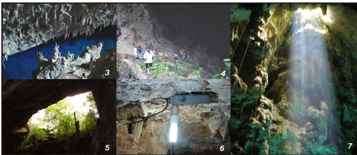
Figuras: 3 – Visão lateral da Gruta do Lago Azul; 4 – A falta de um corrimão no percurso de visitação é um ponto polêmico na Lago Azul. Alega-se que a sua presença poderia causar prejuízo estético ao patrimônio. Por outro lado, a sua ausência aumenta a dificuldade de acesso de pessoas menos preparadas fisicamente e idosos – grupos comuns no local; 5 – Pórtico de entrada da Gruta de São Miguel, e em detalhe (6), luz fluorescente compacta instalada em seu interior; 7 – Visão interna do pórtico de entrada do Abismo Anhumas.

O caso mais representativo que ilustra esta mudança de postura é a região da Serra da Bodoquena, com as grutas de Bonito, MS (Figuras 3 a 7). A tentativa de disciplinar a atividade espeleoturística na região é anterior até mesmo aos fatos citados, podendo ter como marco temporal e divisor de águas o projeto Grutas de Bonito , que apresenta diretrizes básicas para o manejo conservacionista das cavernas da região (LINO et.al. , 1984). Na mesma região, outros fatores externos ao espeleoturismo também concorreram para auxiliar nesta regulamentação, como a criação do voucher único, a obrigatoriedade dos guias locais no passeio e a criação do Conselho Municipal de Turismo – COMTUR –, que, até onde se sabe, é pioneiro no país (LOBO, 2006).