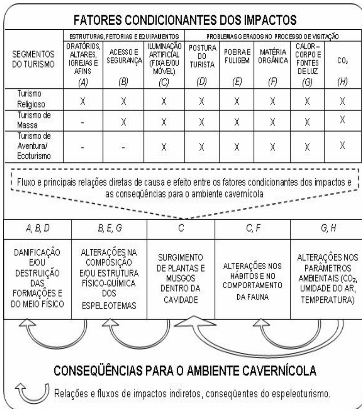
Figura 4 – Relações de causa e conseqüência dos impactos ambientais do espeleoturismo nos meios biótico e abiótico das cavernas (LOBO, 2006a, p. 8)