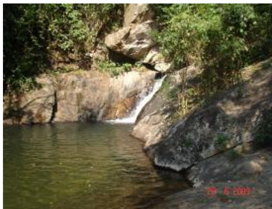
Figura 4: Poço do Casarão, PNMNI.

Figure 3: Home, PNMNI.