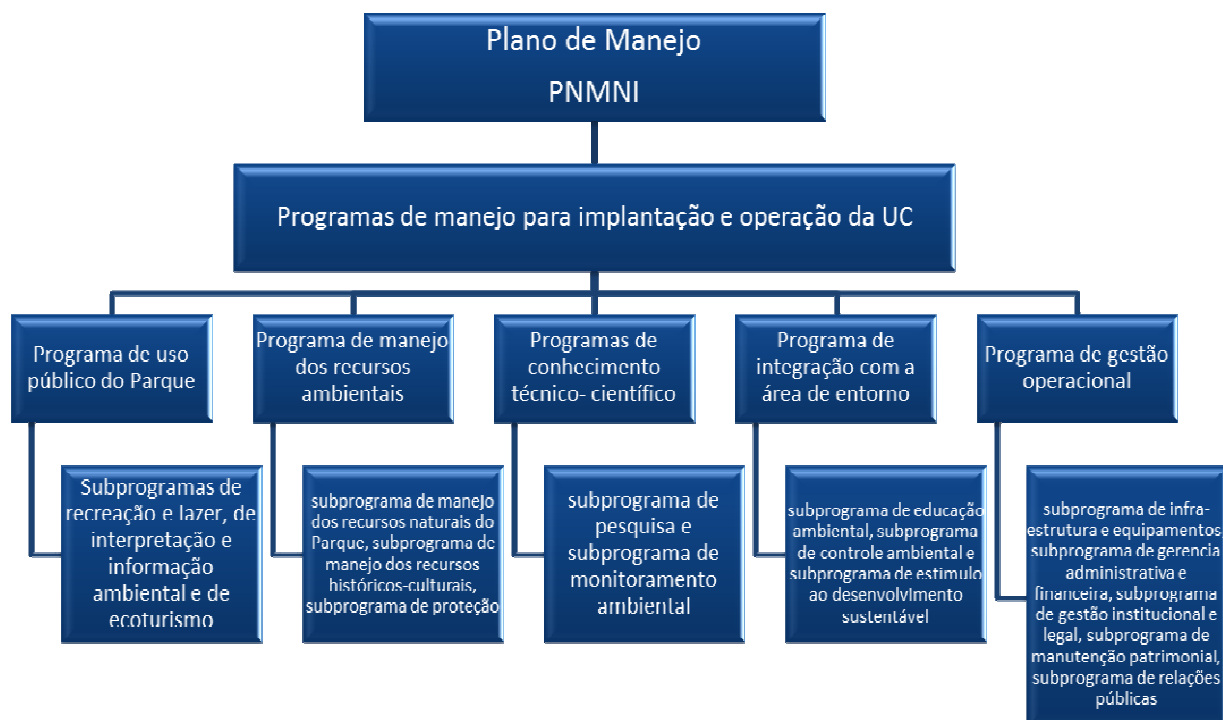
Figura 6: Organograma do Plano de Manejo do PNMNI

e oito questionários respondidos (Tabela 2).