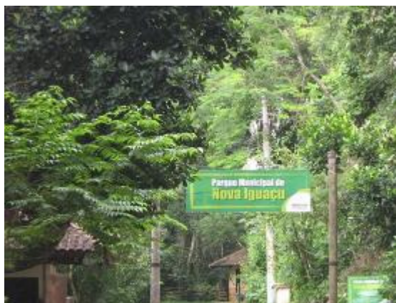
Figura 1: Entrada do PNMNI.

O PNMNI (Figuras 1 e 2) faz parte da Área de Proteção Ambiental (APA) do Gericinó-Mendanha, considerada Reserva da Biosfera pela UNESCO, em 1996. Em 5 de junho de 1998, o PNMNI passou a ser considerado uma Unidade de Conservação de Proteção Integral, pelo Decreto nº 6001, numa área de 10.500 hectares entre as coordenadas 7485/7477 km e 650/658 km. Sua altitude oscila entre 150 metros na entrada da unidade e 956 metros no marco sudoeste, próximo ao Pico do Gericinó (MELLO, 2008).