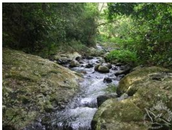
Figura 2: Cachoeira, PNMNI.

Figure 1: Input to PNMNI.