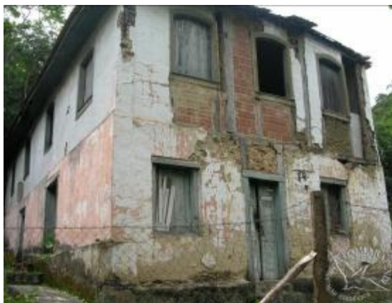
Figura 3: Casarão, PNMNI.

Atualmente, a região da Serra de Madureira destaca-se por ser uma das poucas áreas da Baixada Fluminense que sobrevive à degradação ambiental. Ali se abri-