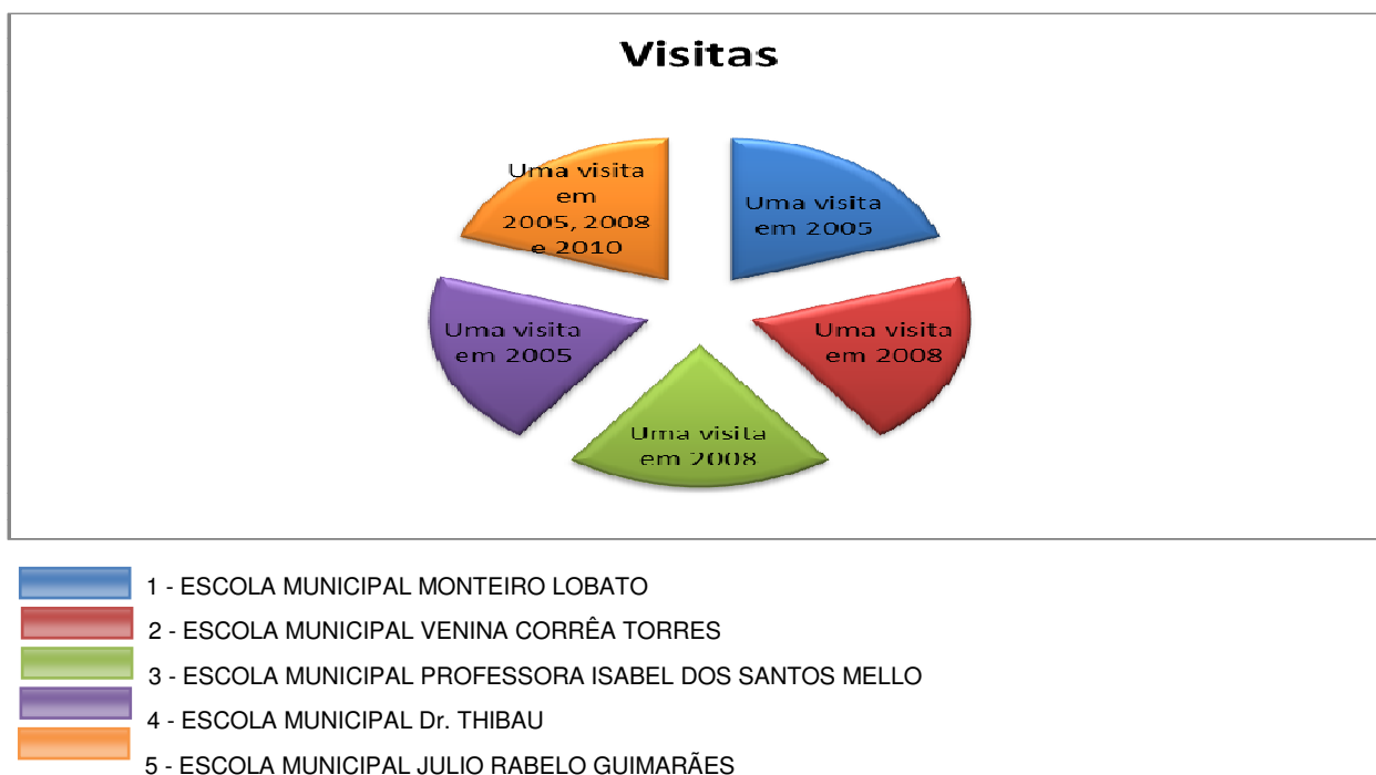
Figura 7 - Periodicidade/ano das visitas ao PNMNI

O objetivo do Subprograma de Educação Ambiental do PNMNI é bastante nobre, que é o de edificar um Programa de Educação Ambiental nas escolas da região, com vistas à construção de atitudes protecionistas ao ambiente (NOVA IGUAÇU, 2001), entretanto, na prática, o processo é diferente. São realizadas poucas visitas orientadas ao PNMNI com os alunos da Rede Municipal de Educação de Nova Iguaçu (Figura 7).