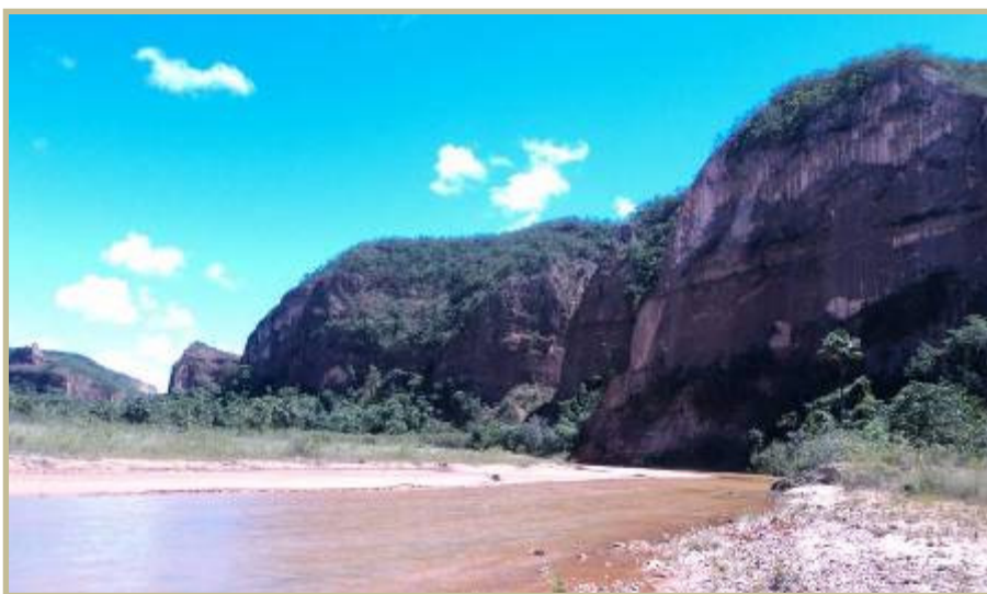
Figura 8: Chapadão da Comunidade de Buraquinhos.

O lugarejo de Buraquinhos (Figura 7), distintamente de Serra das Araras, apresenta uma comunidade geograficamente dispersa, ficando as casas dispostas ao longo do rio Pardo e guardada a devida distância de segurança contra cheias. São, na sua grande maioria, casas de adobe e cobertura de palha de buriti. Ademais das casas, a comunidade carece de estrutura em muitos outros aspectos (ZATZ, 2004).