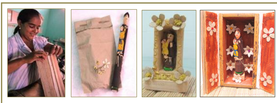
Figura 8: Imagens com a Artesã Rosicley e a produção de oratórios e embalagens da Associação de Bordadeiras e Artesãos de Serra das Araras.

Figure 8: Images with Artisan Rosicley and producing oratorios and packaging of Embroiderers and Craftsmen Association of Serra das Araras.