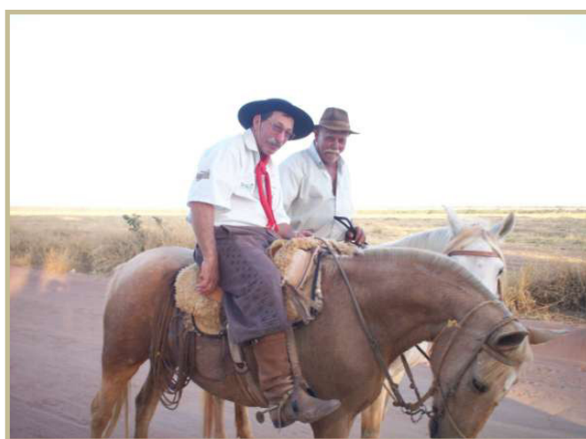
Figura 3: Gaúcho e sertanejo, personagens locais.

Além do chimarrão e do churrasco, os gaúchos trouxeram do sul para os sertões as festas e as danças. Na obra literária “Grandes Sertões Veredas” são narradas os desacertos íntimos do personagem quando declara: “o sertão é dentro da gente”. Estranhamente, a convivência entre os povos é cheia de contradições, um mosaico de diversidades culturais. Observa-se na Figura 3, um gaúcho e um sertanejo caminhando ao trote dos cavalos. Cenas que somente nesta região podem ser assistidas naturalmente. Esta relação desperta o interesse do turismo, que incentiva aos habitantes a manterem suas identidades de origem.