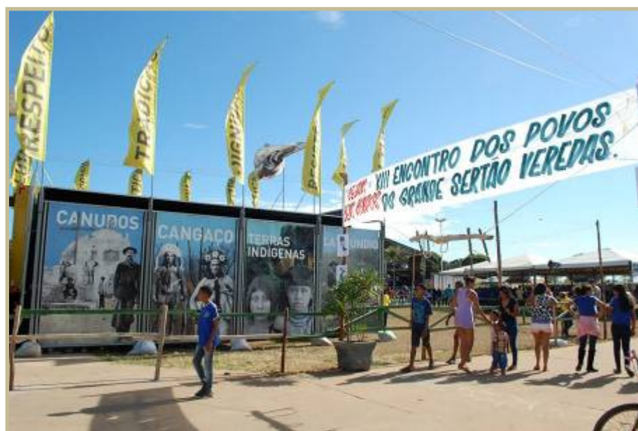
Figura 4: XIII Encontro dos Povos do Grande Sertão Veredas. Figure 4: XIII Meeting of Peoples of the Grande Sertão Veredas.

Com o objetivo de destacar a riqueza cultural da região, há mais de dez anos, é realizado o evento “Encontro dos Povos do Grande Sertão Veredas”, no mês de julho (Figura 4). A proposta do evento é consolidar as manifestações culturais das populações tradicionais que habitam o entorno do Parque Nacional Grande Sertão Veredas e Associação dos Municípios do Circuito Turístico Urucuia Grande Sertão e Velho Chico. Este encontro, conforme Prefeitura de Chapada Gaúcha, estimula a troca de experiências, à comercialização de produtos sustentáveis do cerrado e a discussão sobre políticas públicas, que promovem o desenvolvimento sustentável e social do município.