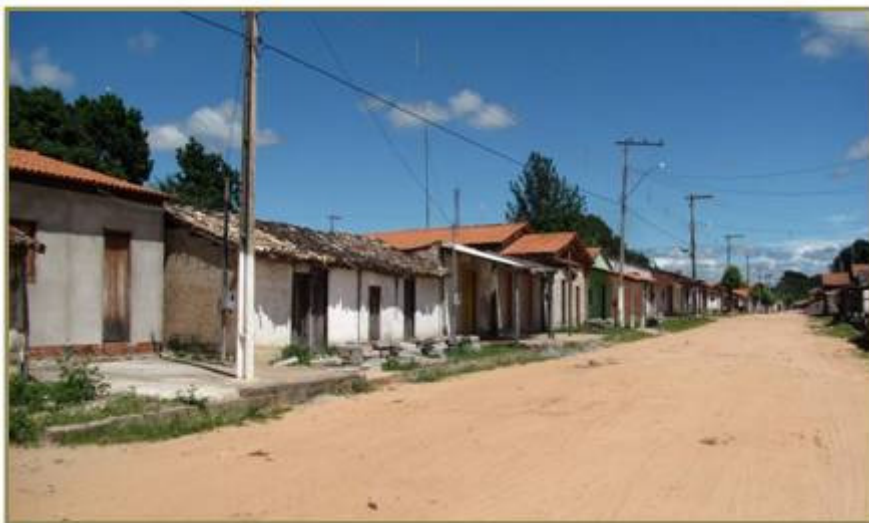
Figura 5: Ruas do Distrito de Serra das Araras. Figure 5: Streets of the District of Serra das Araras.

Retrata-se na imagem da Figura 5, a mansidão das ruas do distrito de Serra das Araras, que suportam o sol e o calor característico da região.