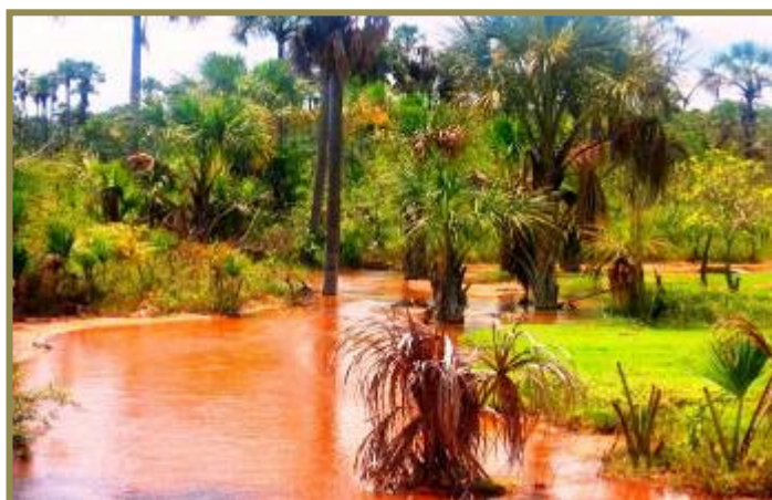
Figura1: Buritis do “Rio Feio”, Distrito de Serra das Araras, Município de Chapada Gaúcha (MG).

Na Figura 1, retratam-se os buritis caídos e sombra sob a água fresca, no leito arenoso e limpo do Rio Feio (que de feio não tem nada), em Serra das Araras, Município de Chapada Gaúcha (MG), cenário semelhante às descrições de Guimarães Rosa (2001, p.26): “ É verde e barrento, quente e espeta (...) o senhor consome essa água, ou desfaz o barranco, sobra cachoeira alguma? Viver é negócio muito perigoso... ”