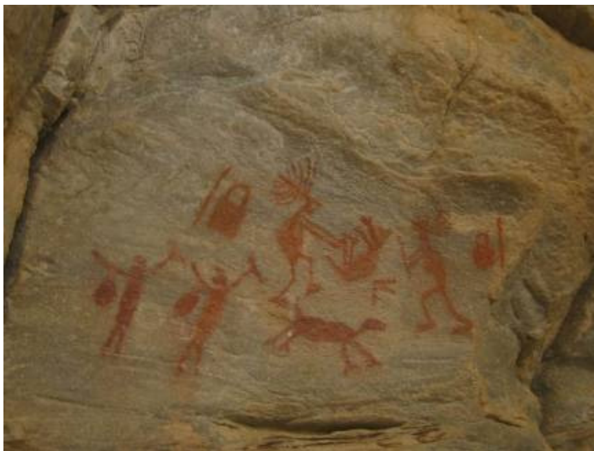
Figura 5: Pinturas rupestres de Tradição Agreste em Carnaúba dos Dantas.

Figure 5: Agreste Tradition of rock paintings in Carnaúba dos Dantas.