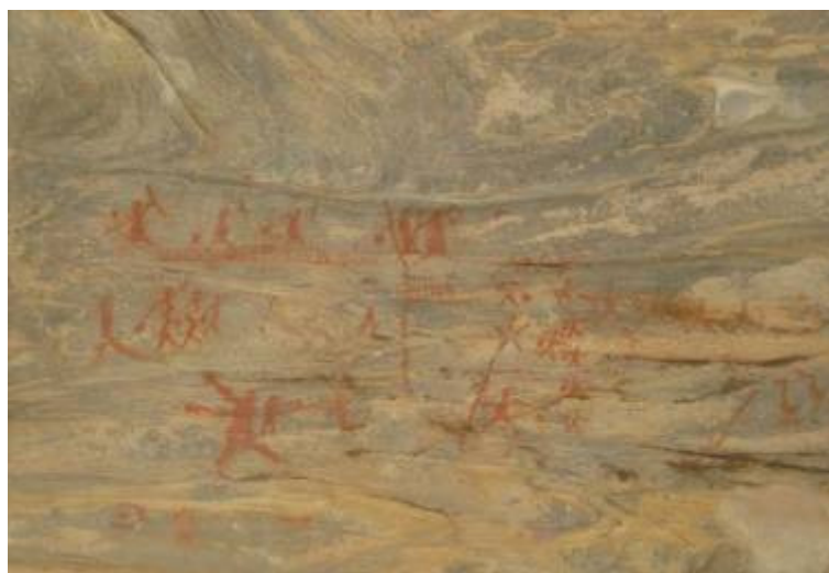
Figura 4: Pinturas rupestres de Tradição Nordeste em Carnaúba dos Dantas. Figure 4: Nordeste Tradition of rock paintings in Carnaúba dos Dantas.

Martin (2008), Monteiro (2000), e Pessis (1992) publicaram importantes documentos que retratam as classificações dos registros rupestres na região do Seridó Potiguar divididas em Tradição Nordeste; Tradição Agreste e Tradição Itacoatiara. A primeira é destacada pela presença de figuras antropomorfas pequenas, isto é, figuras que destacam o plano biológico do ser humano.