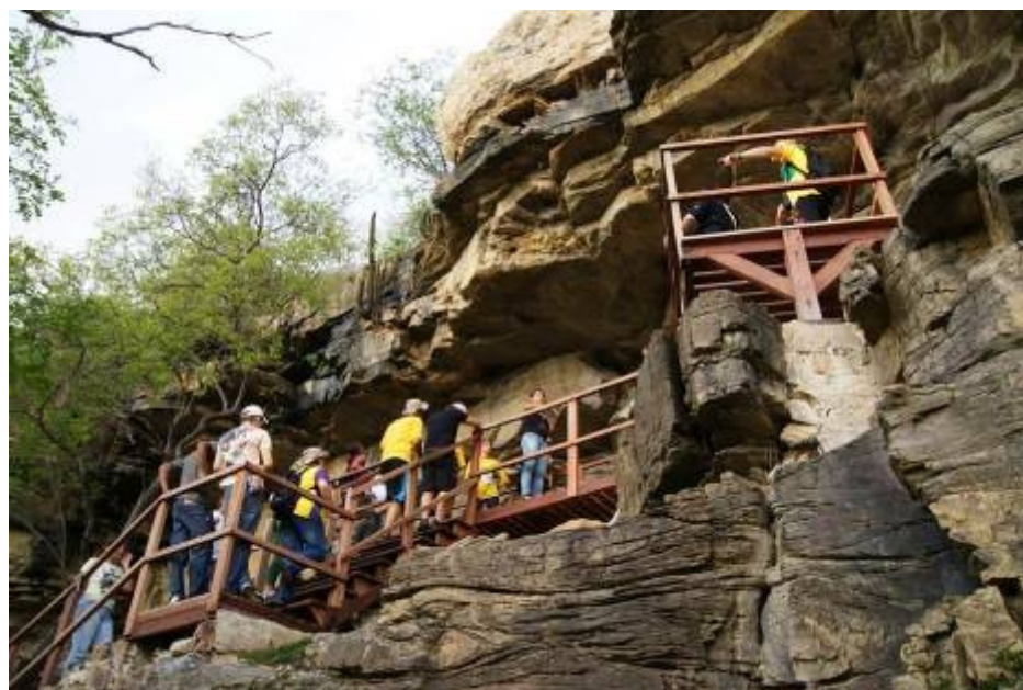
Figura 2: Passarela suspensa no Sítio Xique-Xique 1. Figure 2: Suspended walkway on the Site Xique Xique-1.

De acordo com o IPHAN (2011), o investimento total nesses sítios foi de R$180 mil reais (cerca de US$ 85 mil dólares americanos), destinados a instalações de escadarias; trilhas; áreas de descanso; plataformas de madeira de lei para visualização das pinturas rupestres, entre outros. A inauguração das obras e serviços realizados pelo IPHAN nos sítios Xique-Xique I e II ocorreu no dia 28 de março de 2011.