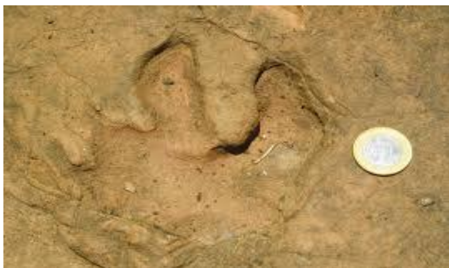
Figura 2: Geossítio, Pegadas de Dinossauros de Nioaque. Icnofósseis/Formação Botucatu.

A riqueza geológica do município de Nioaque permitiu que no Geopark Bodoquena-Pantanal fosse criado o primeiro núcleo do Geopark estabelecendo um protocolo de cooperação e um Plano de Trabalho. Segundo Soares et al. , (2014) os Núcleos são estabelecidos em parceria com Prefeituras, ONGs, empresários privados, entidades que assegurem estabilidade ao projeto e garantam o espaço, equipamentos e os recursos humanos. De acordo com os autores, o objetivo destes polos é que sejam centros dinamizadores das Geociências e promovam a divulgação da cultura científica atuando também como Centro de Visitantes e ou de Atendimento a Turistas.